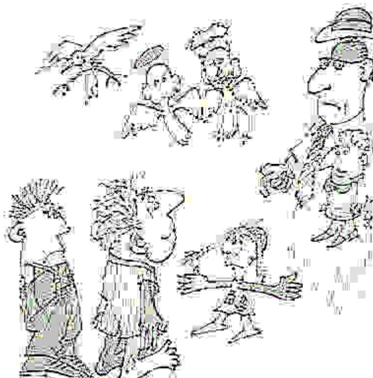
Abbildung 1 7

Abbildung 1 zeigt das fiktive Familienpanorama eines fünfjährigen Mädchens, das seinen Vater groß, die Mutter klein repräsentiert und in seiner Vorstellungswelt das Gefühl hat, es müsse sich gegen seine zwei großen Brüder wehren, die die Eltern zuviel in Beschlag nehmen. (Wer sich für einen Augenblick in das kleine Mädchen hineinversetzt, ahnt vielleicht, welche emotionale Kraft in einer solchen Vorstellung enthalten sein kann.)